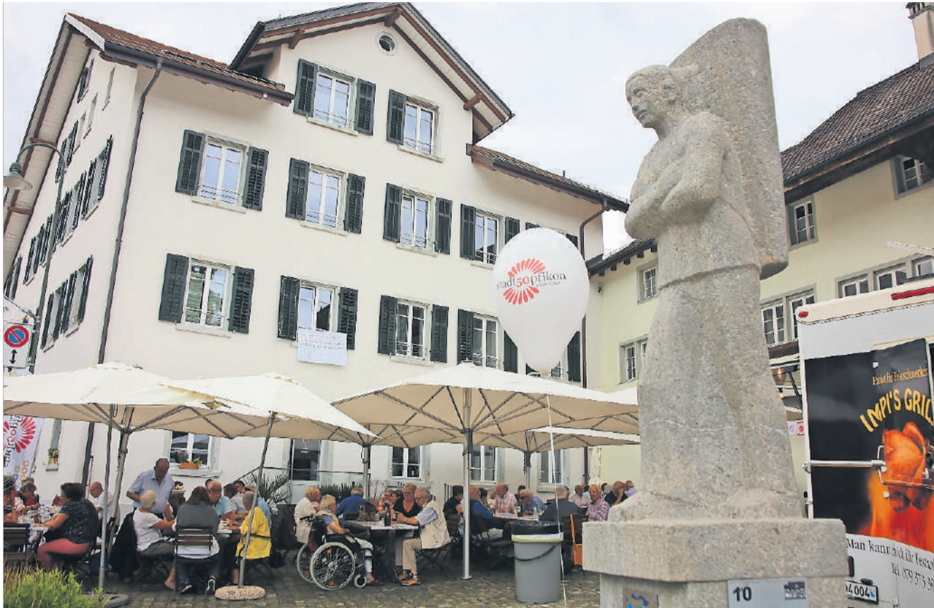
Der Jüngling auf dem Winzer-Brunnen soll die Tanse Wein für Grabarbeiten am damaligen «Neubau» (hinten) erhalten haben; darin befindet sich seit 2014 das neue Restaurant «Wunderbrunnen».

In den 1880er-Jahren errichtete Rudolf Geering den heute noch so ge-