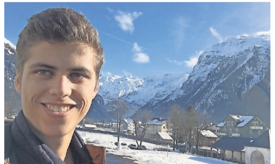
Der Lokalinfo-Redaktor liebte die Natur und Berge.

Egal was kommt, es wird gut, sowieso. Immer geht ne neue Tür auf, irgendwo. Auch wenn's grad nicht so läuft, wie gewohnt. Egal, es wird gut, sowieso.