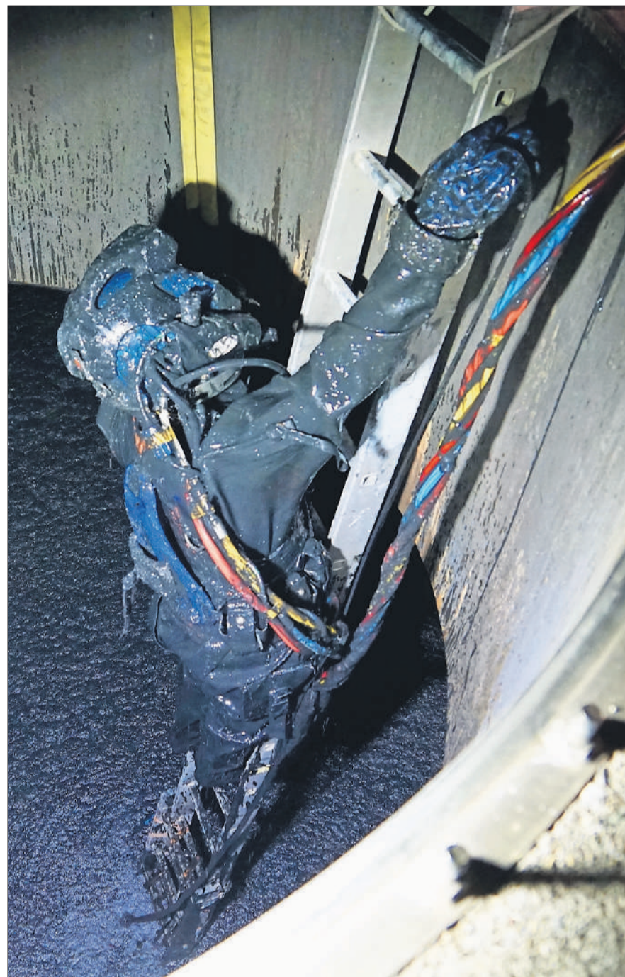
Taucher Mario Müggler hat im Faulturm die Dichtung geborgen.