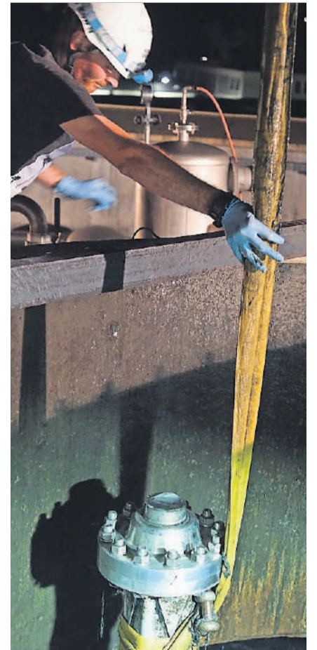
Die Bruchstelle der Welle.