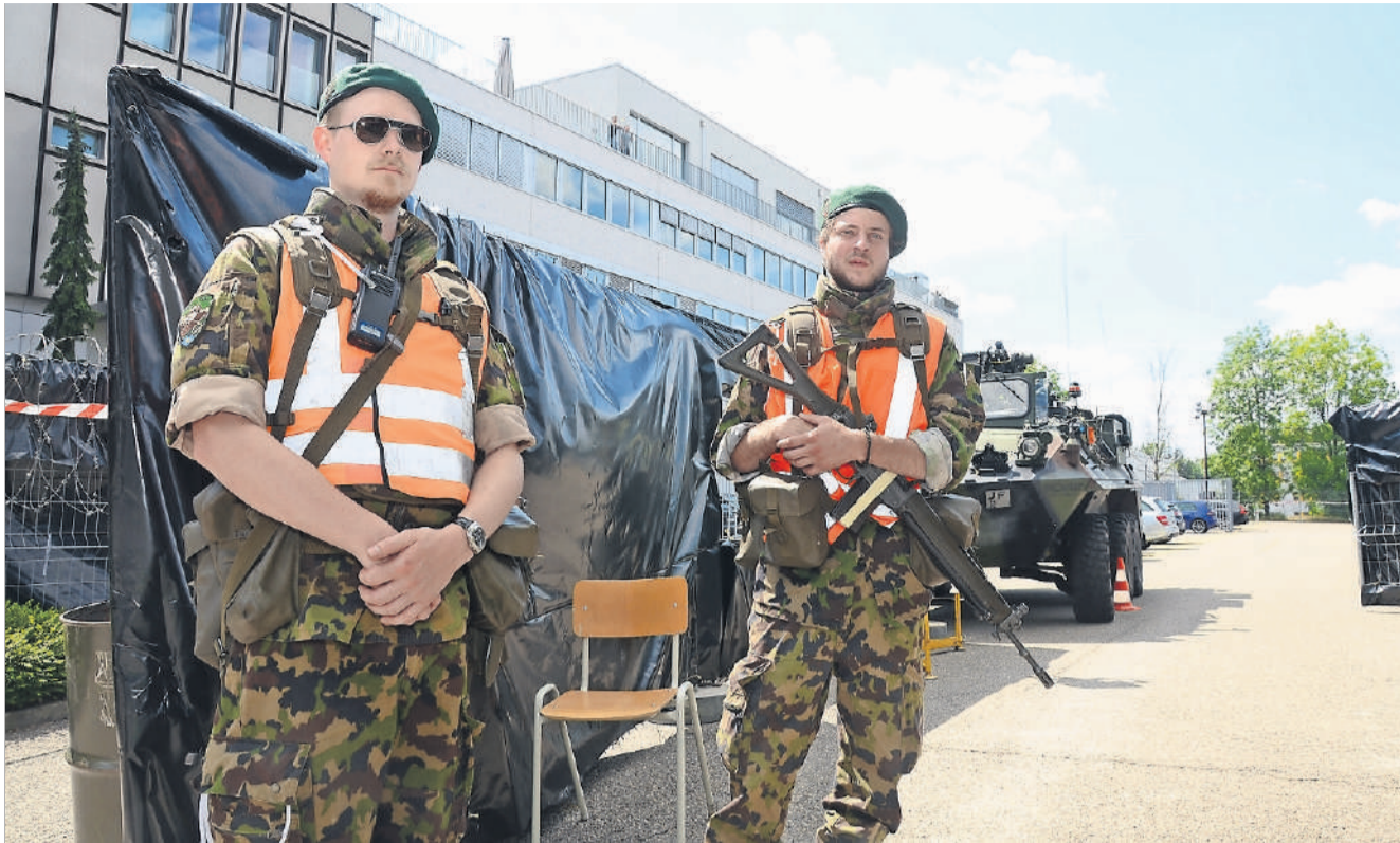
Scharf bewacht: Soldaten des Gebirgsinfanterie-Bataillons 85 bewachen das Rechenzentrum in Glattbrugg, das als kritisches Objekt gilt.

Der Aufwand hat einen Grund: Das Gebäude gehört nämlich zur sogenannten kritischen Infrastruktur. Im