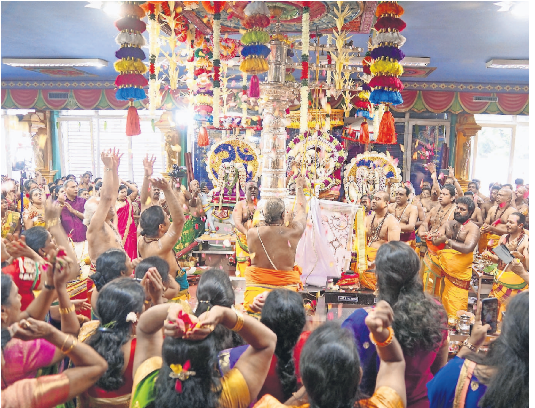
Der erste Tag des Tempelfestes: Beim abschliessenden Aufzug der Fahne mit Symbolen werfen die Umstehenden mit Blumen.

Zum Schluss wird die weisse Fahne, bemalt mit Symbolen, an einer silbernen Stele in der Tempelmitte hochgezogen, wo sie während des ganzen Festes bleibt. Der Eröffnung folgen weitere Festtage, die beispielsweise der Mango gewidmet sind. Jeder die-