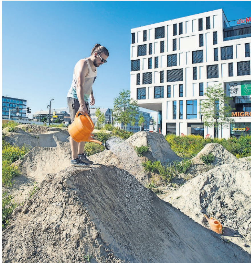
Erst bauen, dann fahren: Mitarbeit gehört immer dazu.