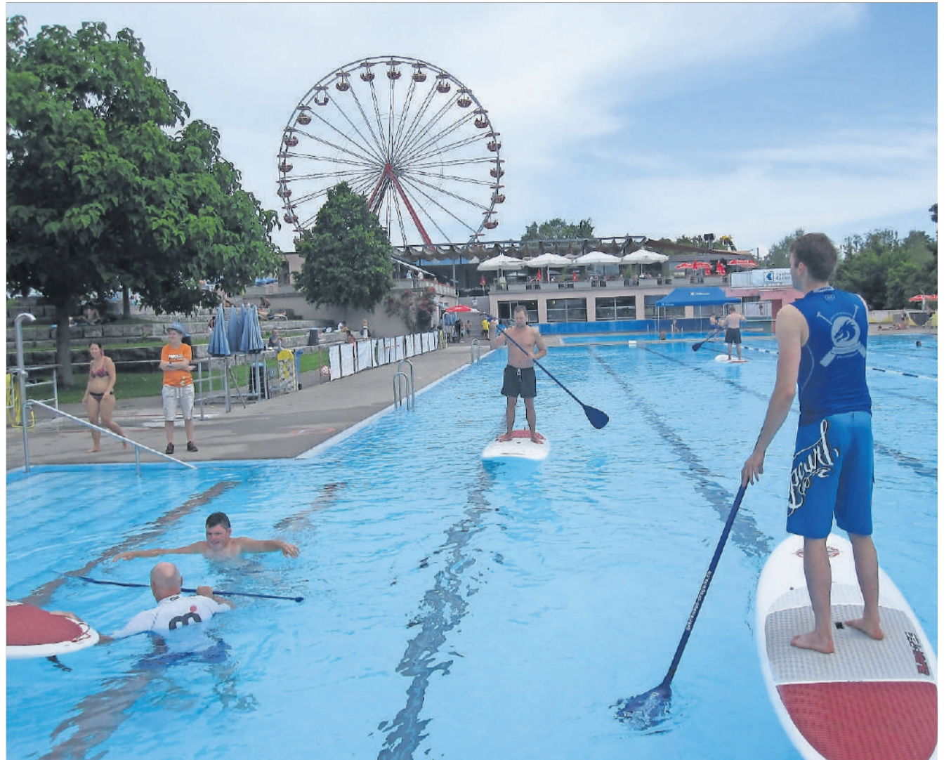
Mit ihrer Defizitdeckungsgarantie sollte die Stadt keinen Schuh voll herausziehen: Attraktionen wie das Stand-up-Paddeling lockten zahlreiche Besucher an.