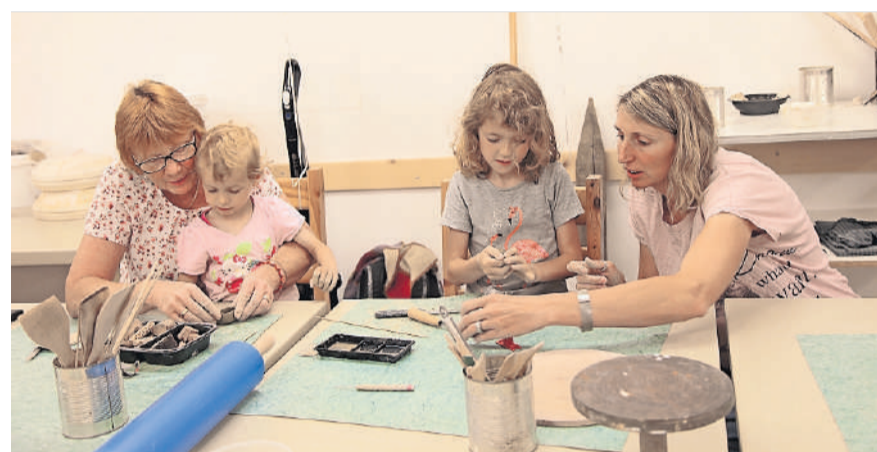
In der Töpferwerkstatt: Zeitvertreib von Müttern und ihren Kindern. Unter geschickten Händen entstehen Schalen und andere Gegenstände.