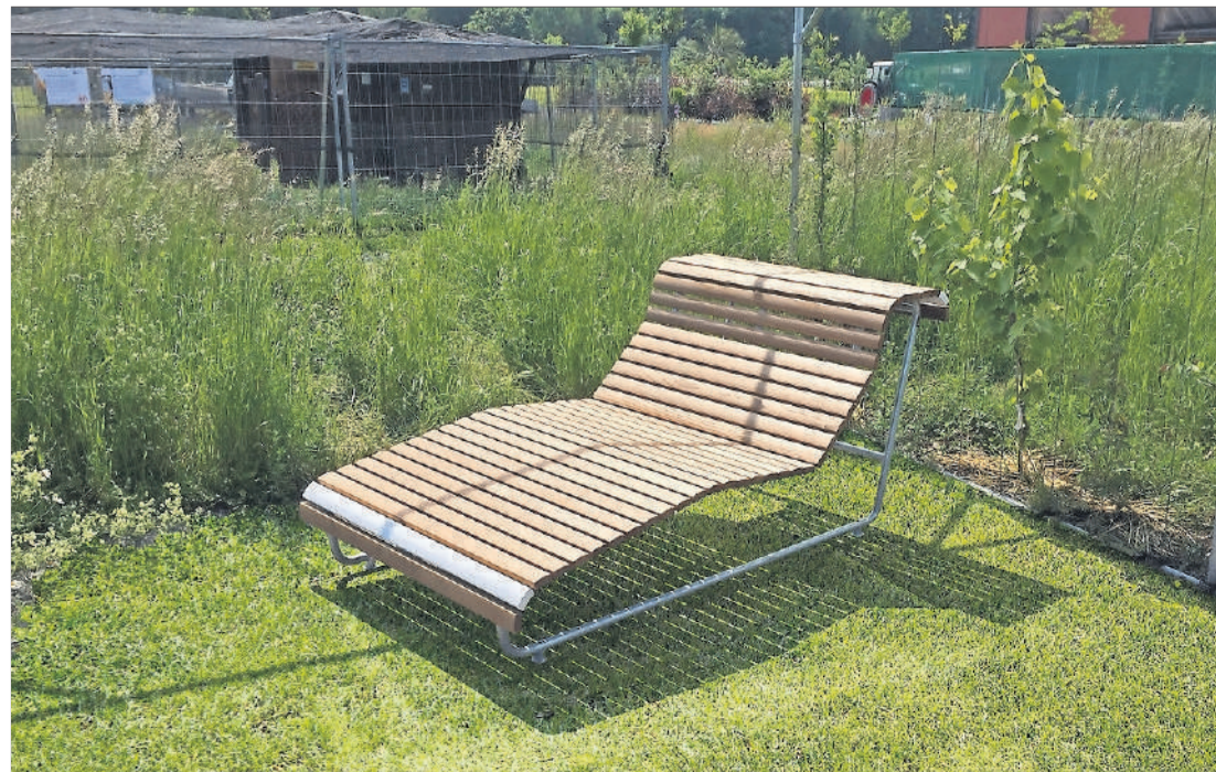
Die Landi-Inklusionsliege wurde von Blinden mitentwickelt.

Die Elemente sind allseitig mit dem Langstock durch Berühren erfassbar. Weisse Aussenlatten helfen Sehbehinderten dabei, die Konturen besser zu erkennen. Optimierte Sitzoberflächen und auf die Ergonomie von Rollstuhlfahrenden angepasste «Transferflächen» machen den Wechsel vom Rollstuhl auf die Sitzelemente möglichst einfach. Es gibt Elemente mit Arm- und Rückenlehnen und solche ohne, sodass möglichst viele Arten der Nutzung möglich sind. Jedes Modell ist komplett in der Schweiz hergestellt, stabil gebaut und form-schön anzusehen. (rs./pd.)