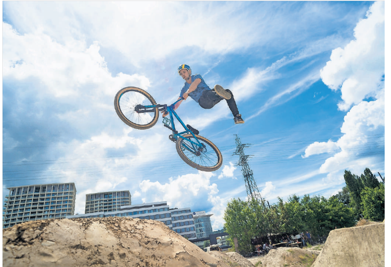
Sind die Schanzen ausgebessert oder neu gebaut, werden sie ausgiebig genutzt.