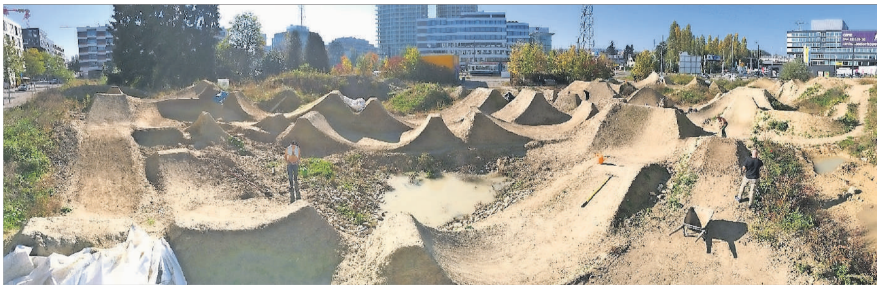
Dank der ständigen Bauerei sieht der Bikerpark immer wieder anders aus – und wird so auch nie langweilig.

Flirt with Dirt: Sa, 30. Juni, ab 10 Uhr, bei der Haltestelle Glattpark; www.ntdirt.ch